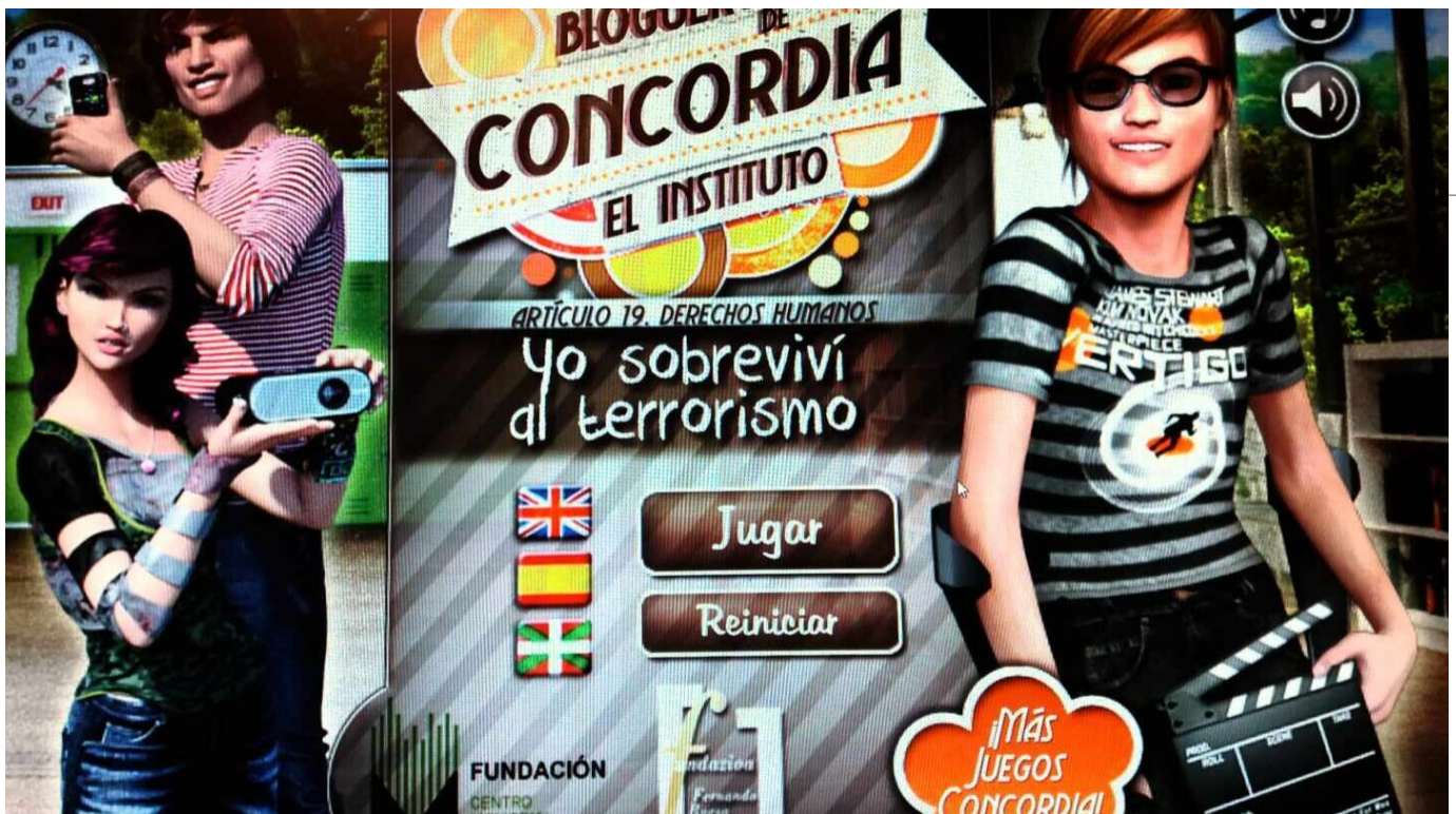
videojuego dedicado a la deslegitimación del terrorismo.

La historia se ubica en un instituto. Iker, un joven aspirante a cineasta se prepara para el estreno de su cortometraje. La temática, los derechos humanos y la deslegitimación del terrorismo, han suscitado un pequeño revuelo entre parte de sus compañeros, «los broncas», dispuestos a impedir bajo amenazas y argumentos el estreno de la cinta titulada 'Yo sobreviví al terrorismo'. Así es el primer videojuego dedicado a abordar de modo directo el terrorismo y su deslegitimación y que esta mañana, coincidiendo con el Día Internacional de los Derechos Humanos, presentarán en Vitoria la Fundación Fernando Buesa y el Centro Memorial de Víctimas del Terrorismo .